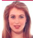
PRODUKTION Bc. Petra Blažková

Büro der Messeverwaltung: Mimoňská 645, Praha 9 – Prosek